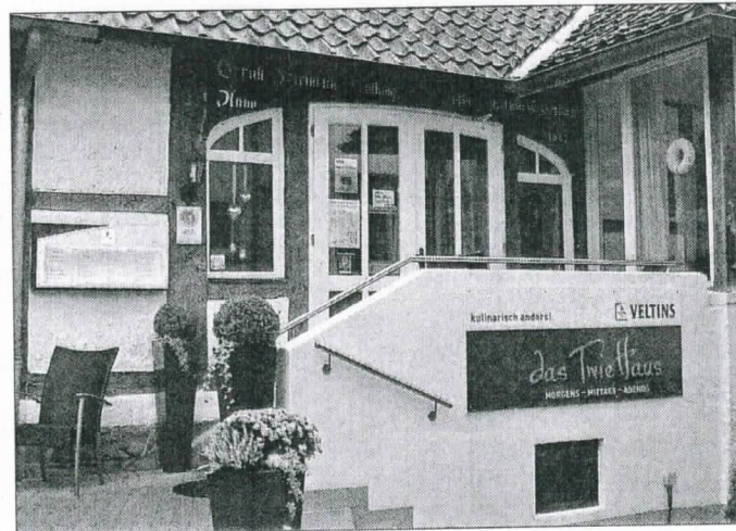
Karsten Twiehaus verwöhnt seine Gäste in „das TwieHaus“ in Kirchrode, Tiergartenstraße.

Weitere Infos unter Telefon 05 11 / 70 03 64 34 oder www.das-twiehaus.de