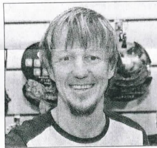
Det Seeska feiert 25-jähriges Geschäftsjubiläum.

nem Paar kostenlosen neuen Laufschuhen belohnt, wenn er unter die drei ältesten Exemplare kommt. Die Fundstücke werden vom 16. bis 29. November im Geschäft ausgestellt und laufend auf der Homepage www.laufshop.de präsentiert.